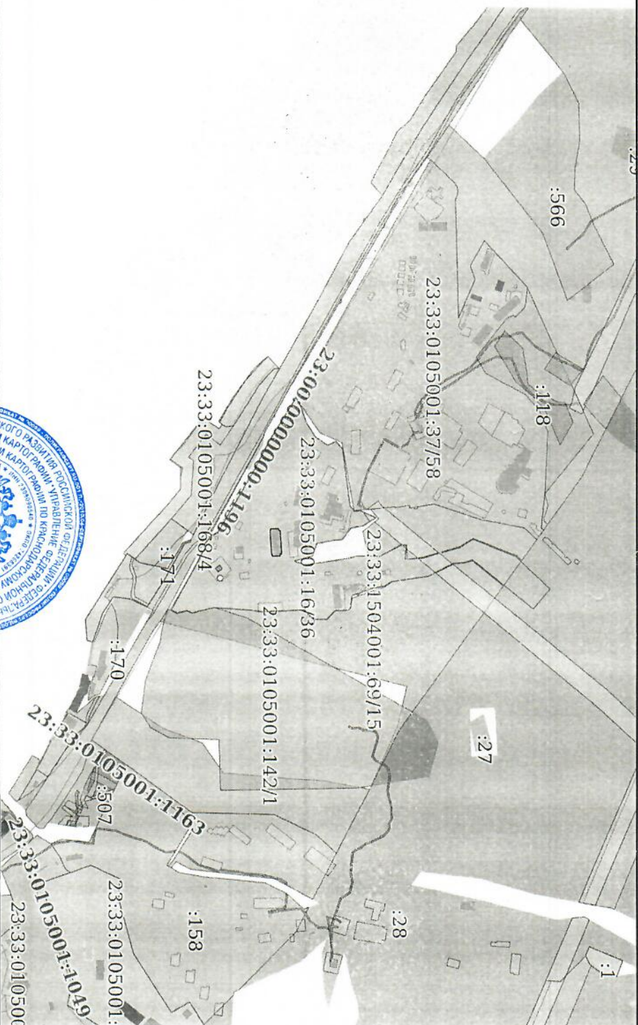
Схема расположения объекта недвижимости (части объекта недвижимости) на земельном участке(ах)