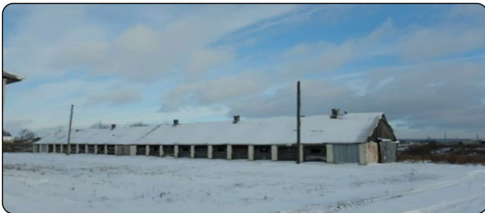
Фото предмета залога