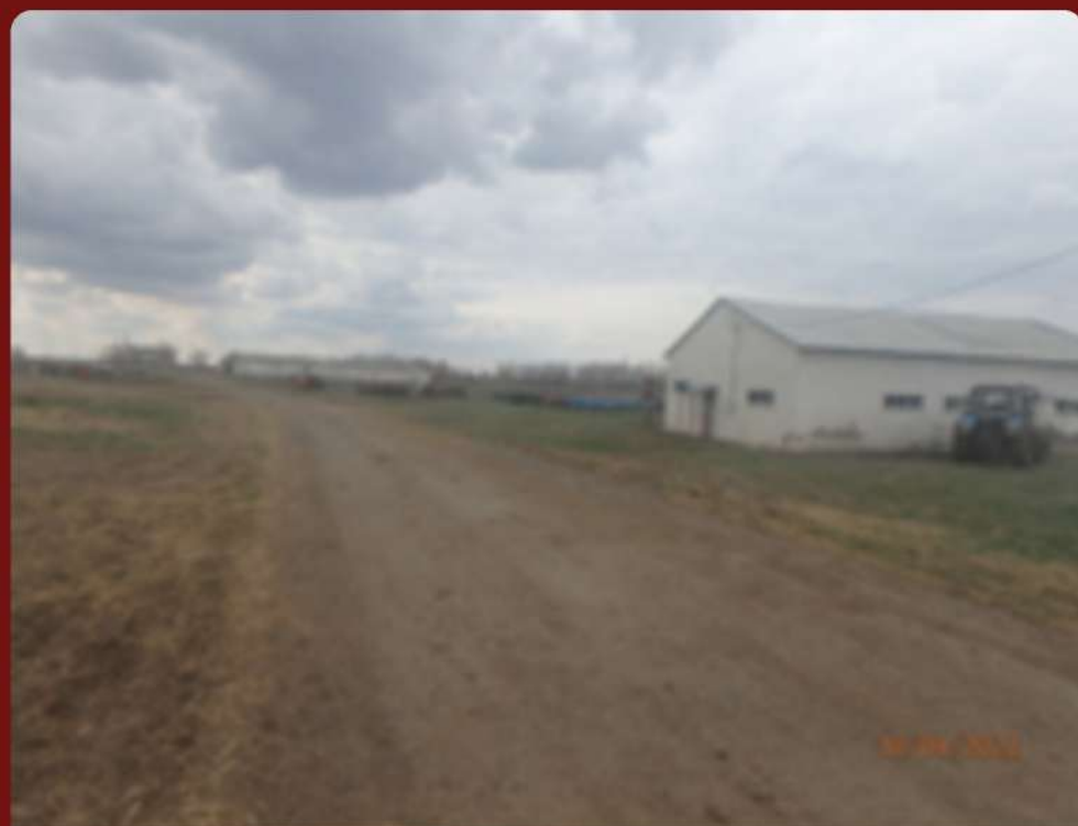
Производственная площадка № 1 (Оренбургская область, Оренбургский район, п. Экспериментальный)