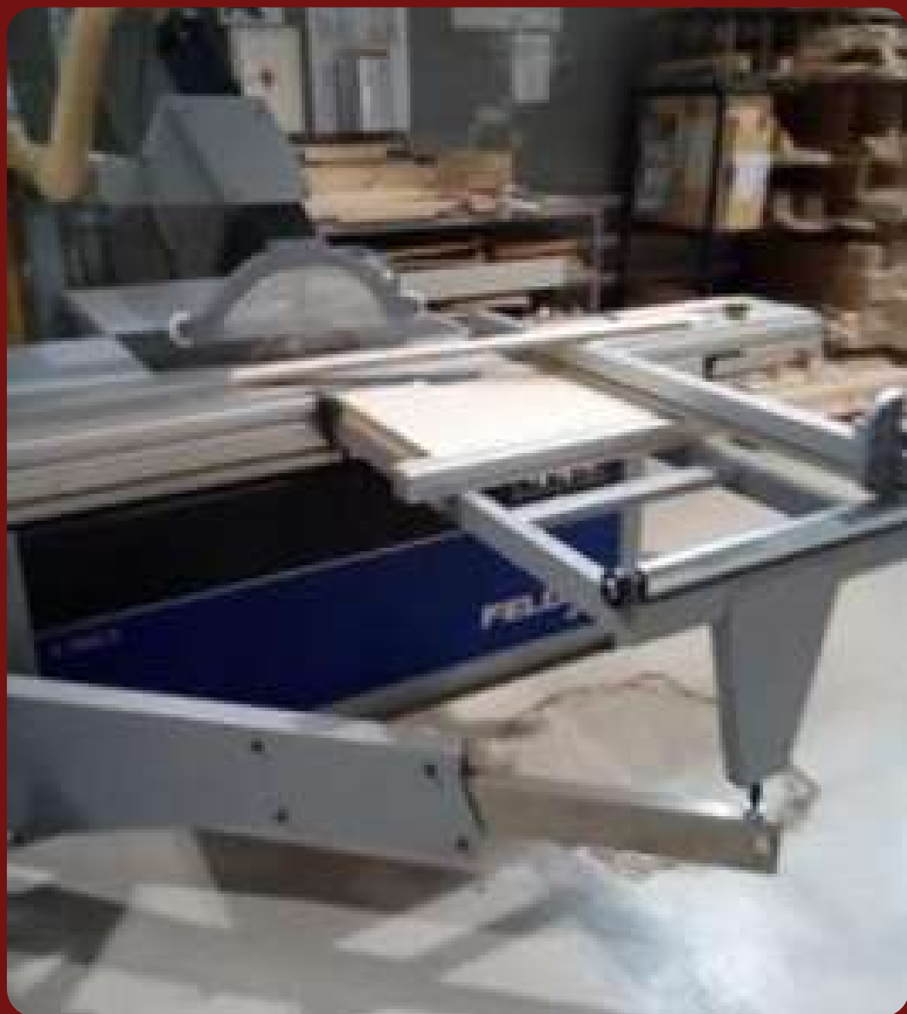
Форматно-раскроечный станок K940S FELDER