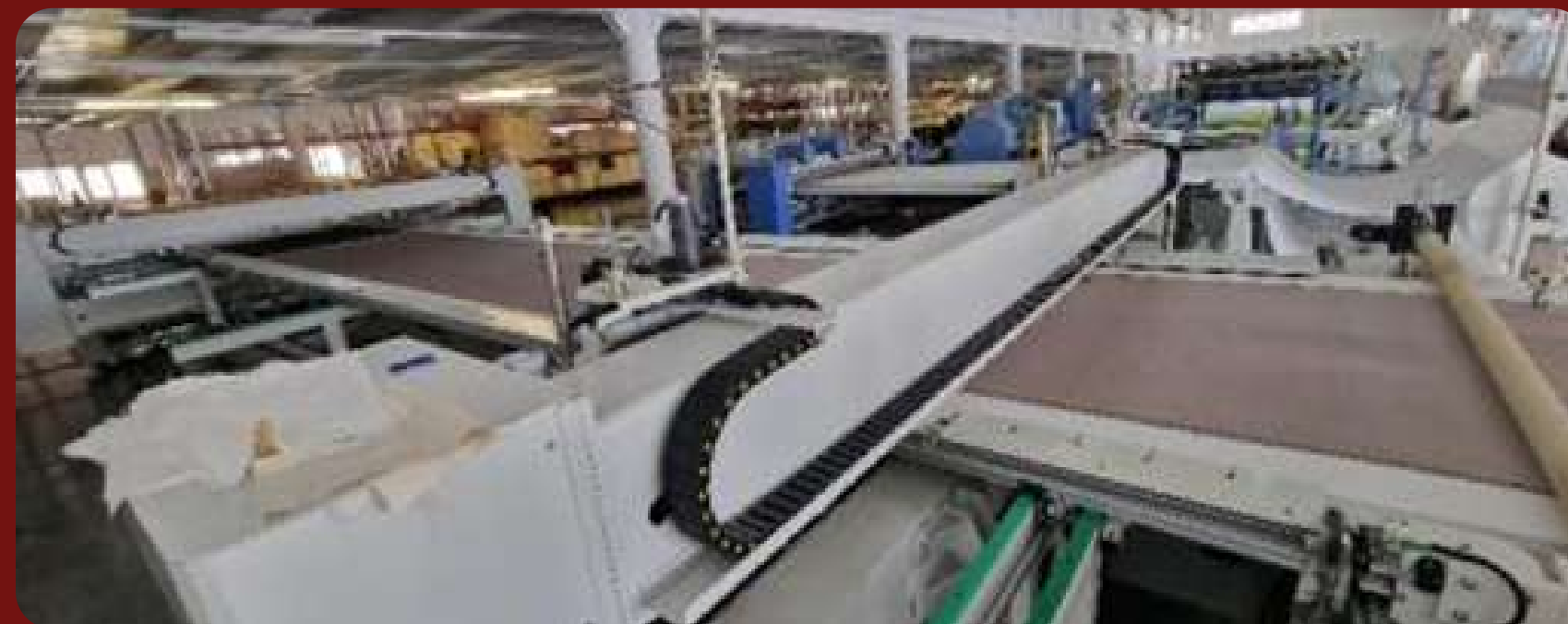
Стегальная одноигольная машина TEKNOMAC S.R.L., инв. 00645