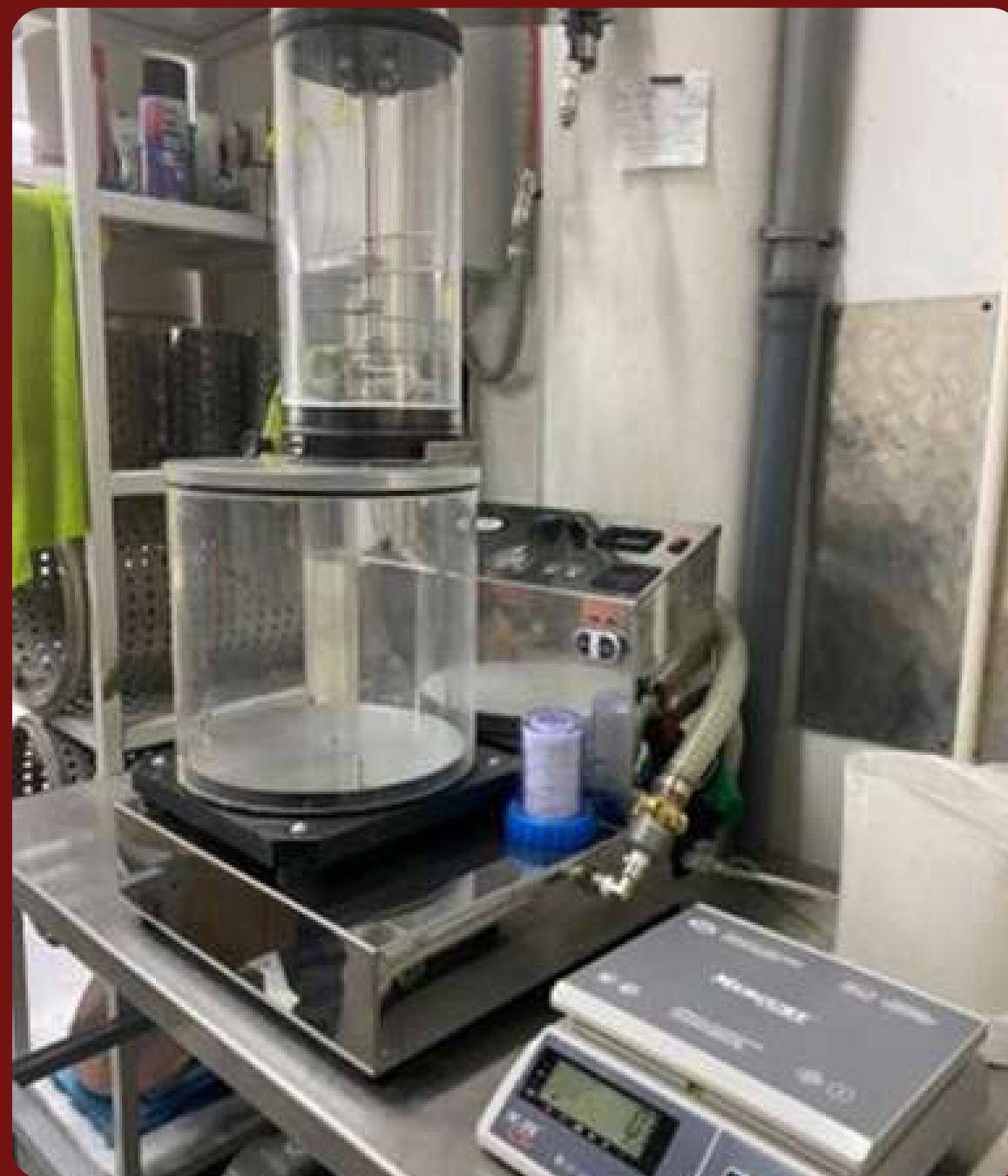
Миксер вибровакuumный МУЛЬТИМИКС 7.220, без вак.насоса