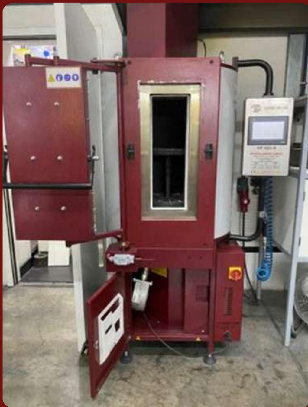
Вращающаяся муфельная печь