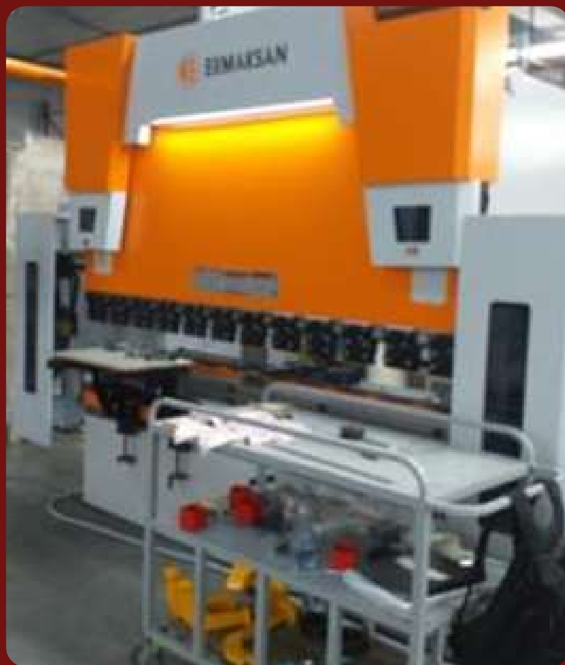
Пресс листогибочный гидравлический POWER- BEND FALCON 2600x135 ЧПУ Delem DA58T