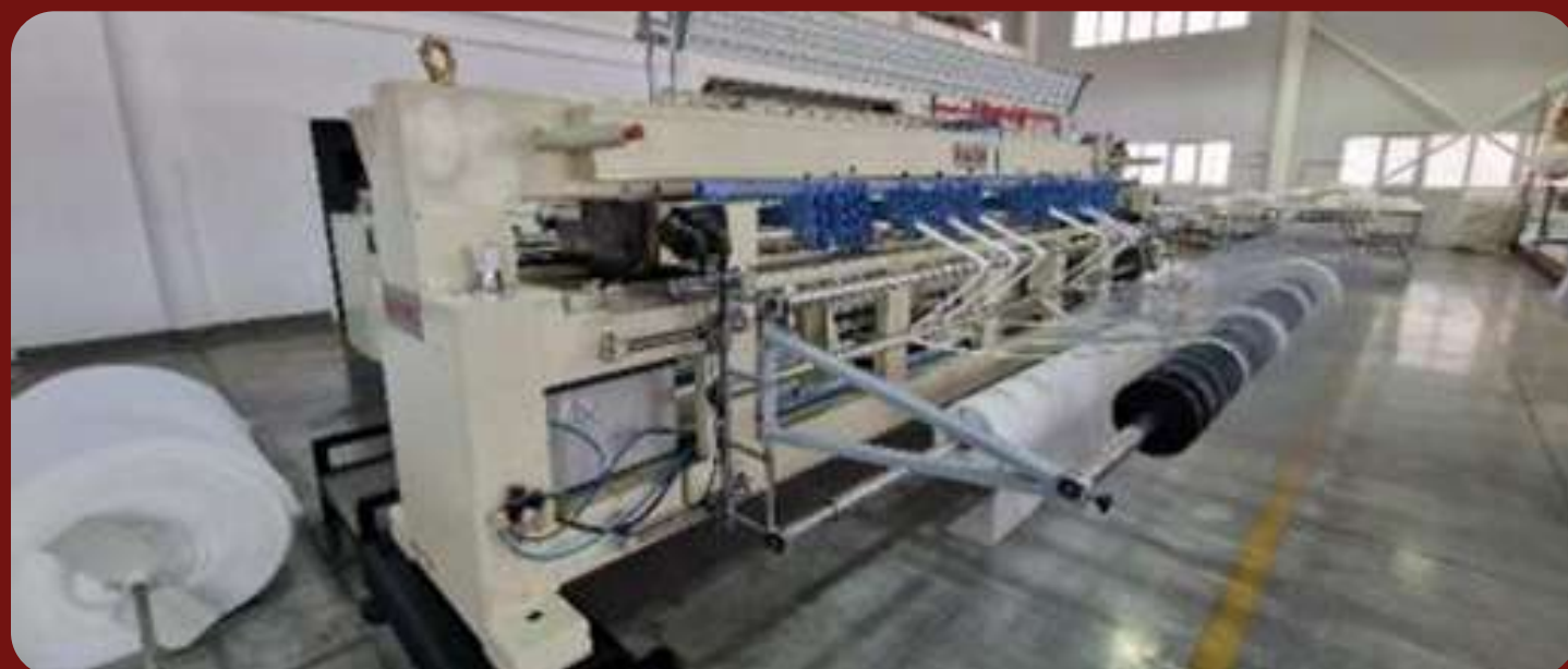
Стегально-вышивальная машина L 2000, инв. 00559