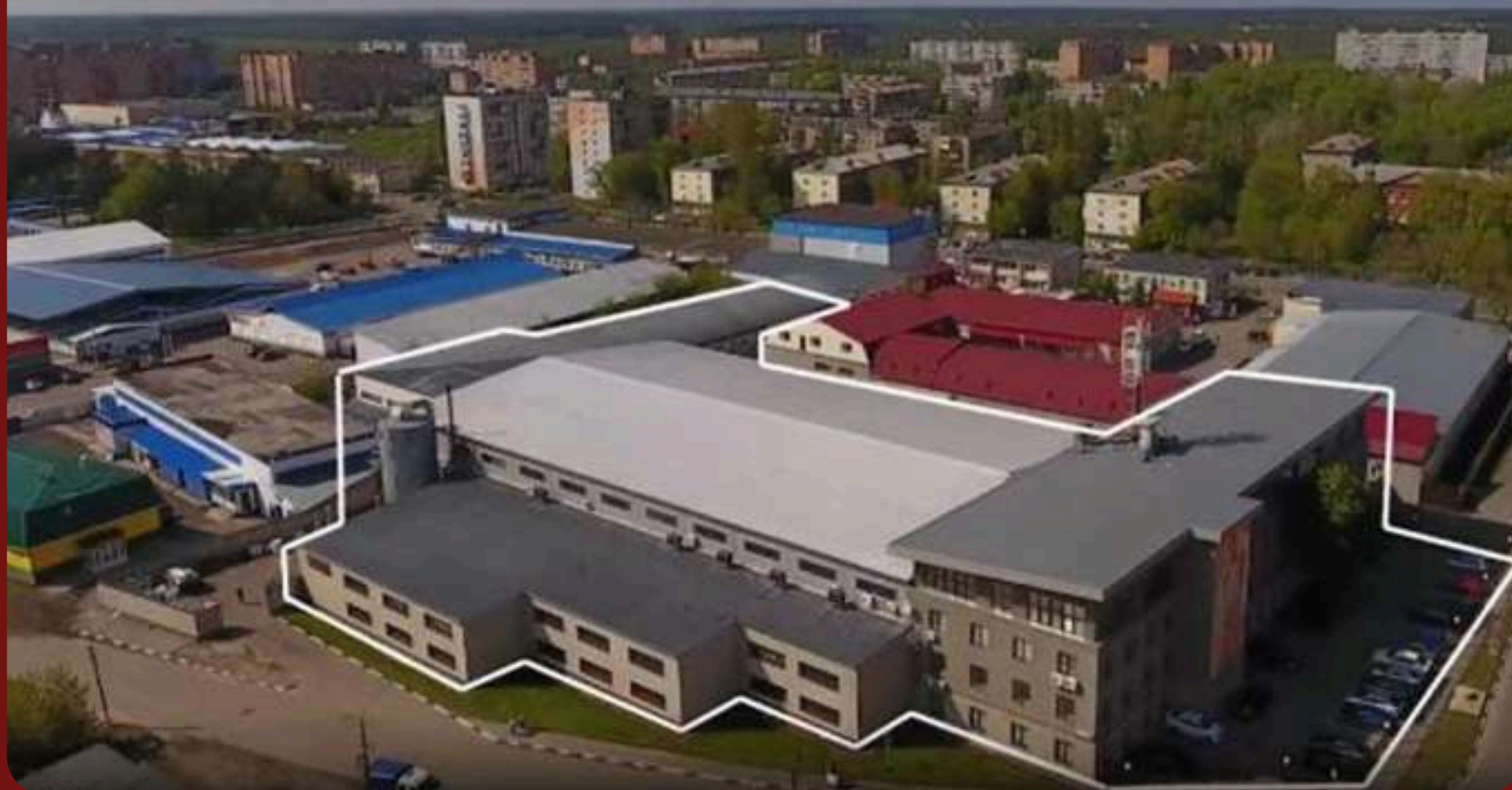
Мебельная фабрика ESTETICA производственная площадь 12 000 м 2