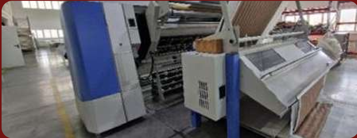
Автоматическая многоигольная стегальная машина МАММУТ VMK 250 CNC