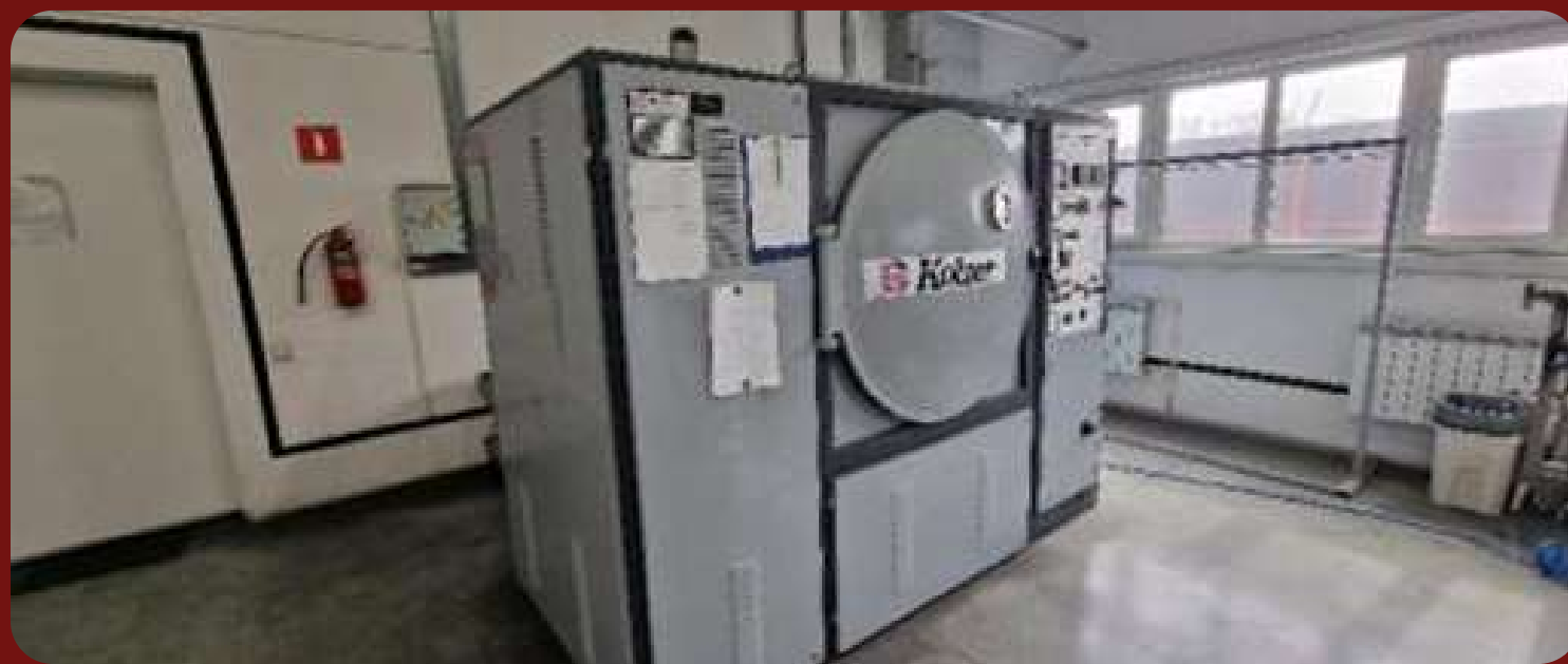
Оборудование для металлизации - Станок для вакуумного напыления металла Kolzer с установкой охлажден