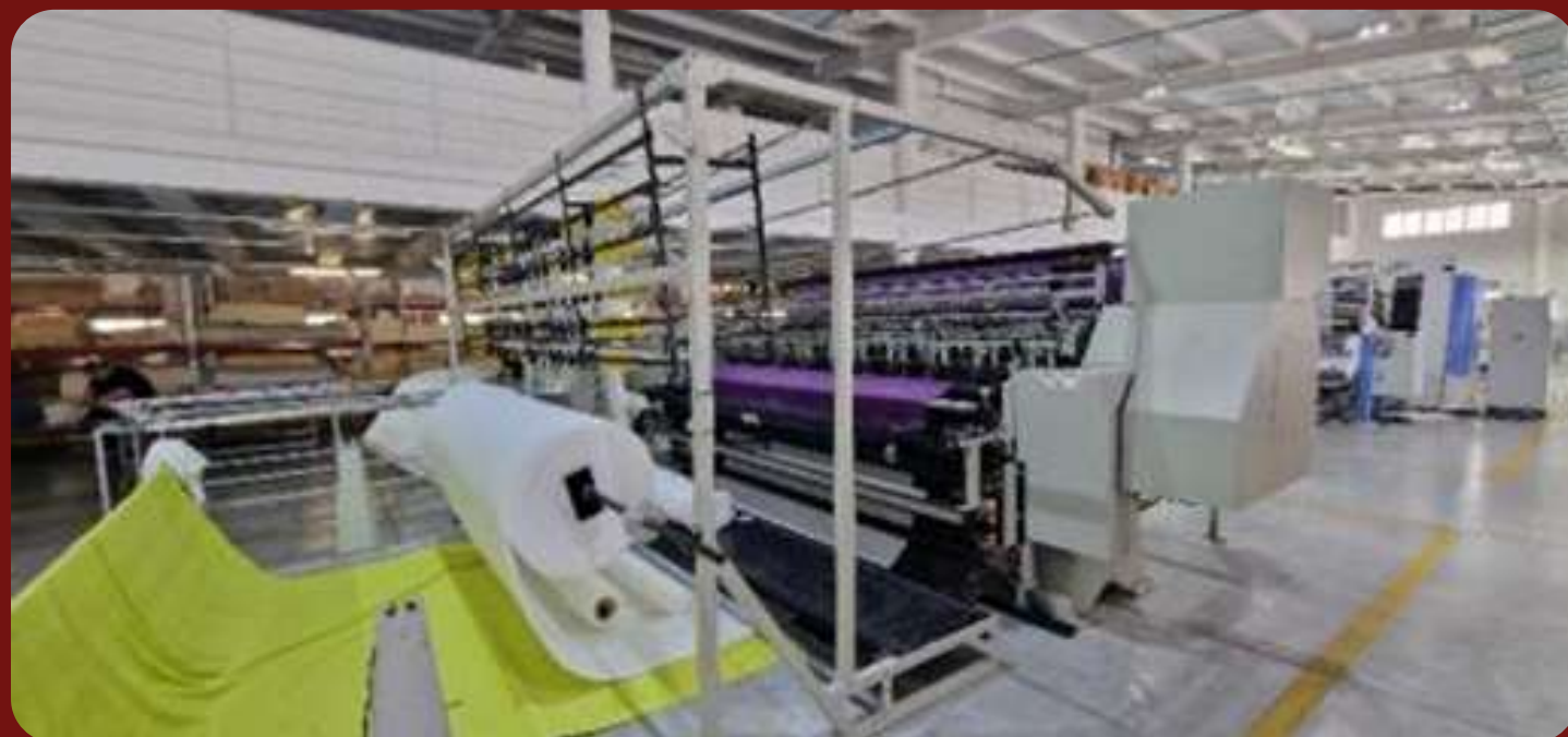
Стегальная машина Shuttle 1200, инв. 00664