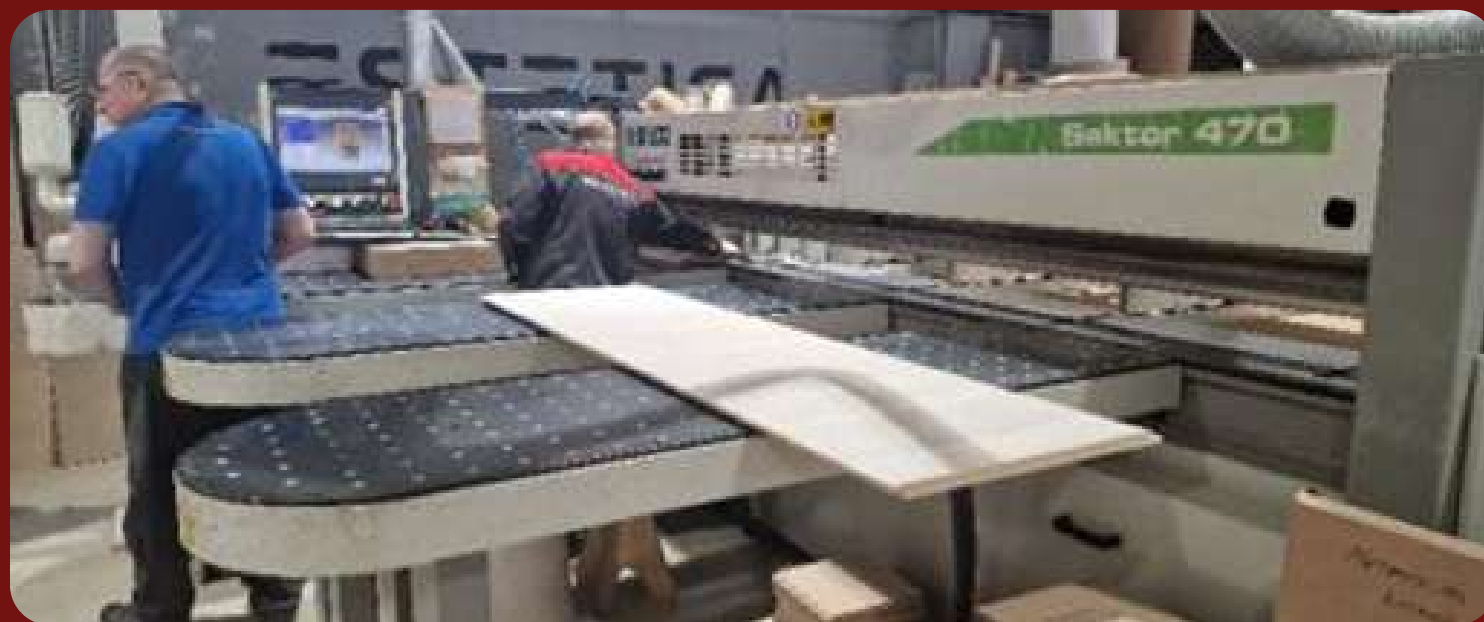
Раскройный центр с ЧПУ SEKTOR 470-K1