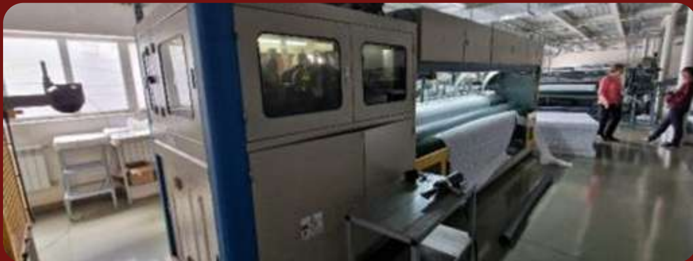
Автоматический станок по производству блоков типа box spring