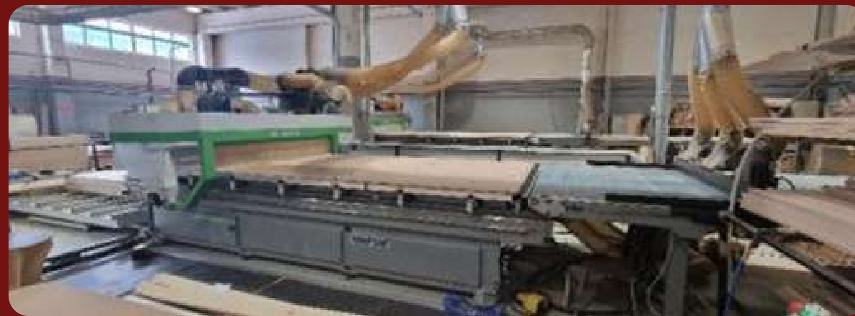
Обрабатывающий центр с числовым программным управлением Rover A 1836 G FT (6*12') в комплекте