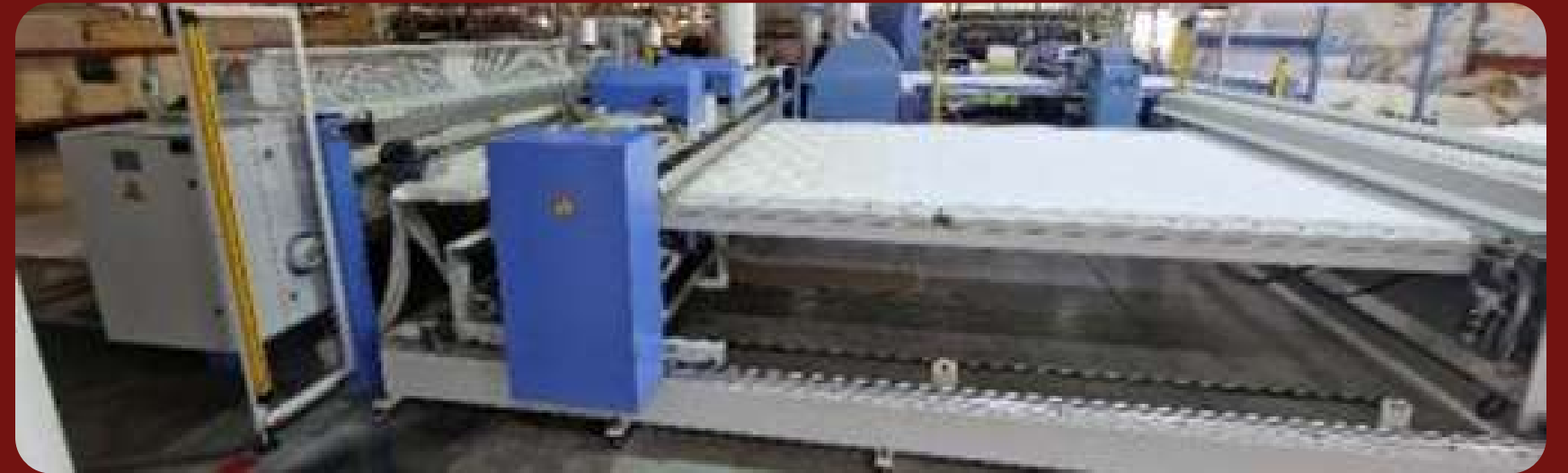
Автоматическая Одноигольная стегальная машина МАММУТ P2A 240 челночного стежка