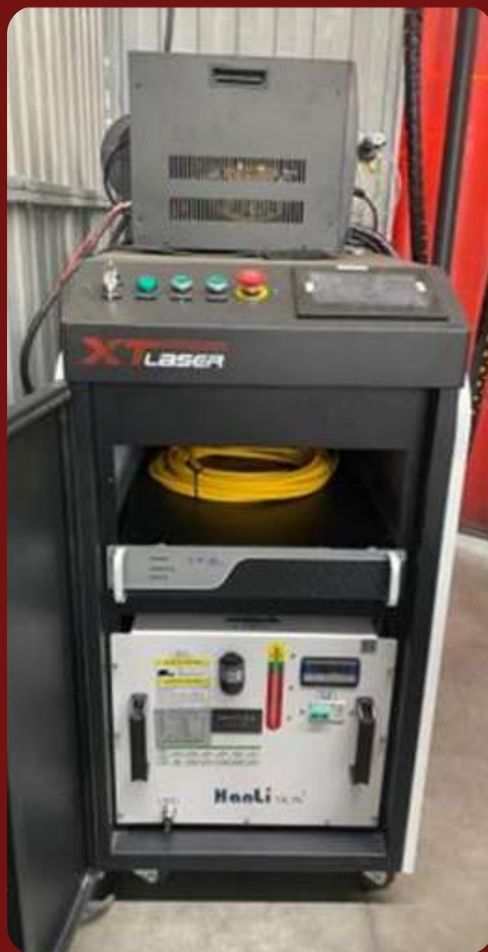
Лазерная сварка XTW-1500Вт IPG